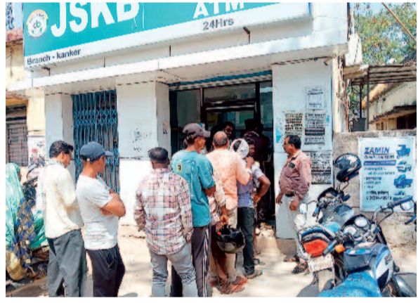
का उचित प्रबंध नहीं किया गया है। घंटों लाइन में खड़े रहने के कारण