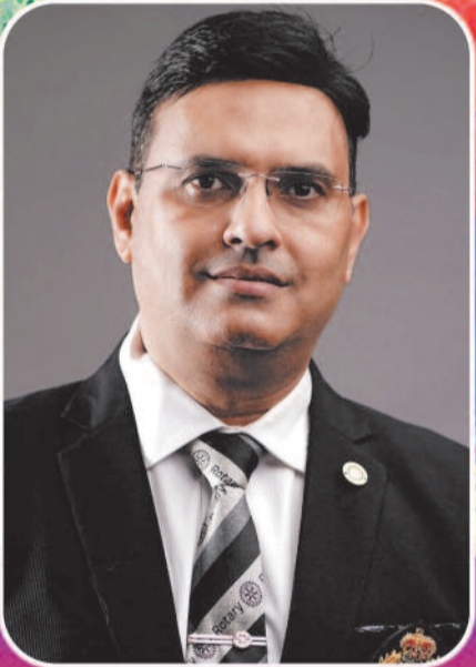
नवीन भावसार सेटरी डिस्ट्रीक गवर्नर